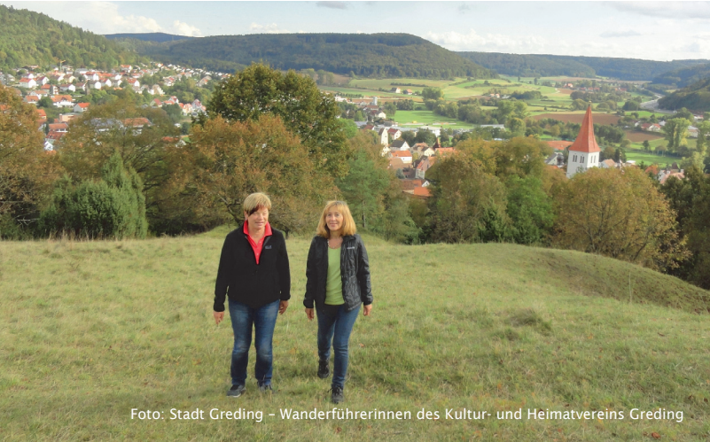
Foto: Stadt Greding – Wanderführerinnen des Kultur- und Heimatvereins Greding